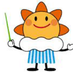
気象庁マスコットキャラクター 「はれるん」

気象大学校は気象庁の幹部候補生を養成するための機関であり、気象大学校学生は気象に関する専門的知識、技術などについて気象大学校で4年間の教育を受けたのち、気象庁本庁又は全国各地の気象台などに配属され、観測、調査、予報及び研究などの気象業務に従事します。