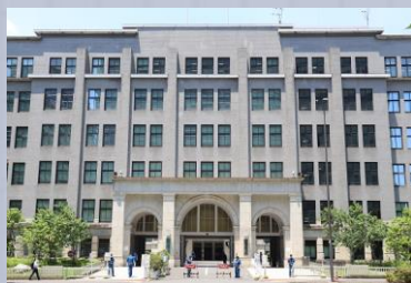
ざいむしょう 財務省