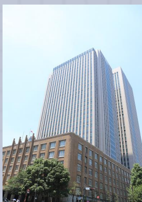
もんぶかがくしょう 文部科学省