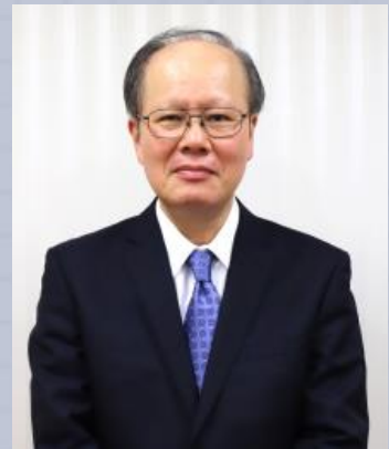
はぶ じんじかん 土生 人事官

そうさい ふたり じんじかん にん はな あ だいじ 総裁と2人の人事官だよ。3人が話し合って、大事な ことを決めているよ。 そうさい じんじいん だいひょう いろいろ き 総裁は、人事院の代表として、色々なことを決めているよ！