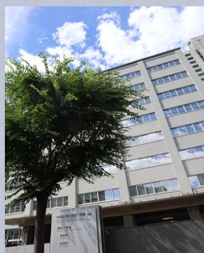
のうりんすいさんしょう 農林水産省