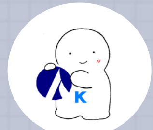
こっかこうむいんさいようしけん 国家公務員採用試験 イメージキャラクター KOH(こー)ちゃん

こっかこうむいん しけん つく 国家公務員になるための試験を作ったり、 いっしょ 実施したりしているよ！