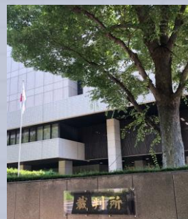
さいばんしょ 裁判所