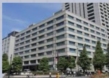
じんじいん 人事院