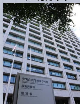
こうせいろうどうしょう 厚生労働省