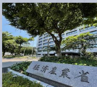
けいざいさんぎょうしょう 経済産業省