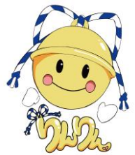
国家公務員倫理審査会 公式マスコット