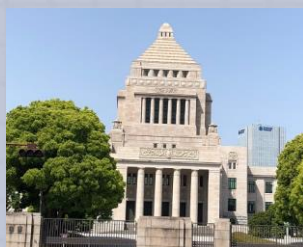
こっかいぎじどう 国会議事堂