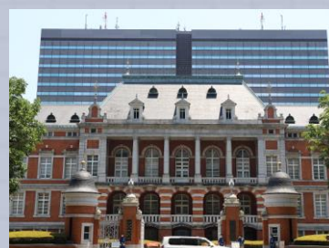
ほうむしょう 法務省