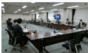
金融機関との会議の様子