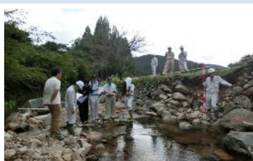
被災地の現地調査の様子