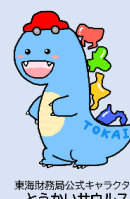
東海財務局公式キャラクター とうかいサウルス