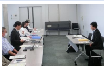
ヒアリング調査の様子