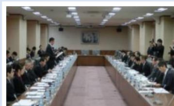
財務省での経済情勢報告

※もっと業務内容を知りたい方は、東海財務局 HP の「業務紹介パンフレット」をご覧ください。