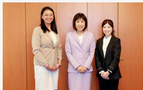
▲川本総裁とシンガポール公務員局からの「日シンガポール知見交換プログラム」参加者