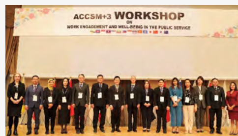
▲ASEAN+3 公務協力会議(ACCSM+3) 国際ワークショップ

また、ガバナンスの向上が課題である開発途上国からは、日本の公務員制度を学びたいとの要望が多く、人材育成のための研修の実施に協力しています。