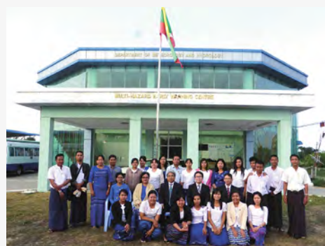
▲派遣職員の業務風景 (中央列、左から4人目が派遣職員)