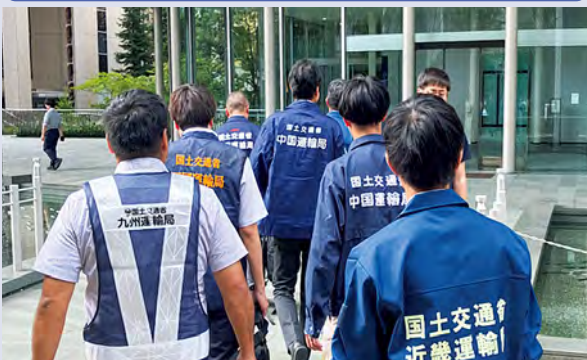
▲ 他地域の運輸局との合同パトロールの様子