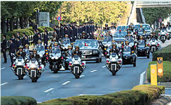
▲ 天皇陛下御即位に伴う祝賀御列の儀における護衛の様子

外務省 ミャンマー地震対応チーム (海外緊急展開チーム及び国際緊急援助隊医療チーム)