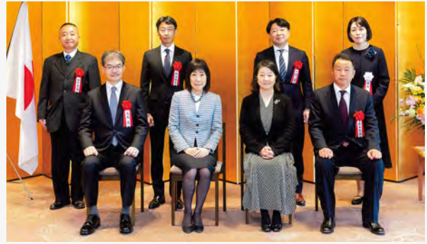
▲ 人事院総裁賞授与式の模様(令和8年2月)