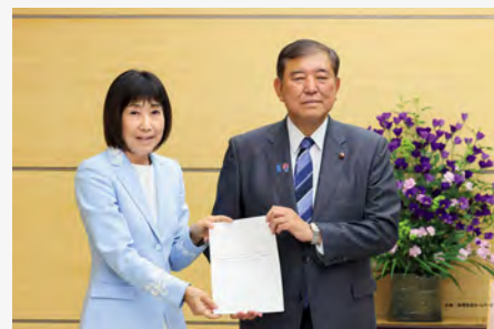
令和7年8月7日 石破首相(当時)に勧告を手渡す川本総裁