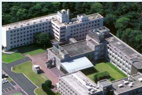
▲人事院公務員研修所(埼玉県入間市)

歴史的意義の大きい行政事例を題材とする講義や討議を通じて、行政官として取るべき行動について多角的視点から考える。