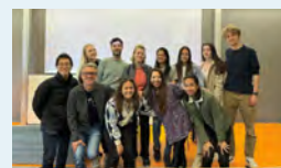
▲ティルブルフ大学(オランダ)にて