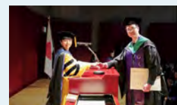
▲政策研究大学院大学にて