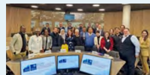
▲オックスフォード大学(英国)リーダー派遣にて

2024年度に新設した管理職を短期間海外の大学院に派遣する「リーダー派遣コース」をさらに拡充しています。