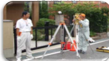
▼土地を測量する様子

商業・法人登記では、商号や代表者名など、会社・法人の重要な情報を登記簿に記録して公示しています。