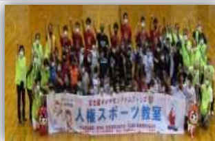
◀人権啓発活動の様子

人権侵害による被害者の救済を図る調査救済活動や、人権尊重の理念を広めるための人権啓発活動を行っています。